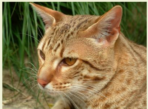
Auxarcs Mr. Darcy

Wij zullen haar wijze raad en expertise missen.