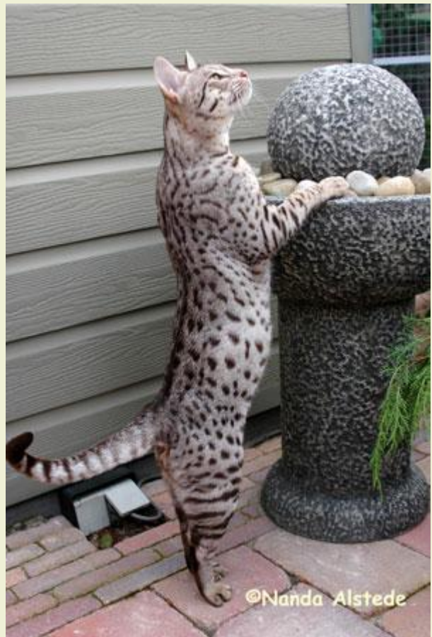
Mischa Grob Cattery Meulicats

Denzel was invited to for a photo shoot for Rodi Petfood. We wait with interest when he will appear on the packaging of Rodi Petfood. In the beginning of 2009 there was also a photo shoot (Over Dieren) his pictures appears in a book of Cats and Kittens. A nice picture is shown in Mundikat magazine and Nanda Alstede wrote a nice story.